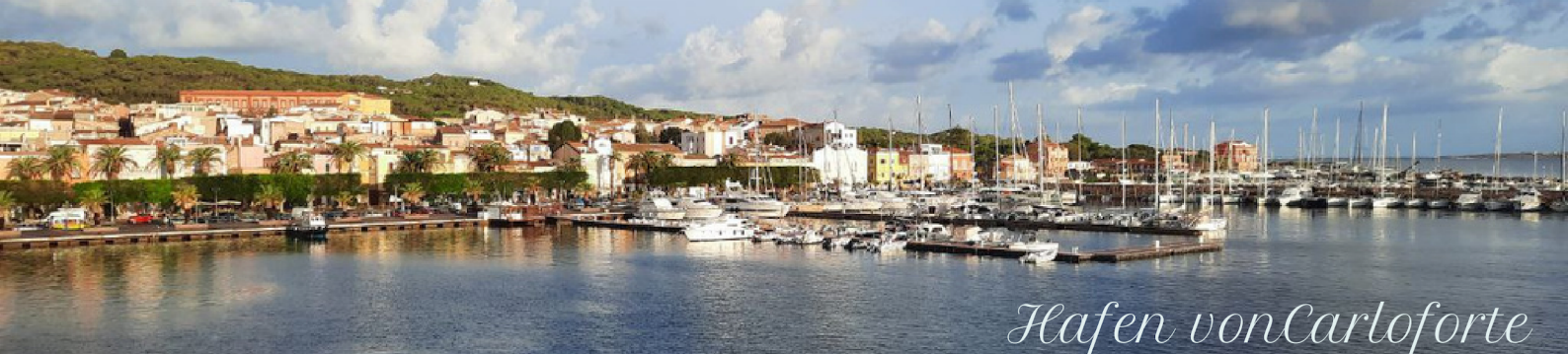
Hafen von Carloforte